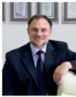
АФАНАСЬЕВ Дмитрий Владимирович, Заместитель Министра науки и высшего образования Российской Федерации

«...Социально активная, инициативная молодежь – авангард человеческого капитала в нашей стране. Именно они готовы преодолевать барьеры и стереотипы, связанные с человеческими различиями. Принятие и взаимопомощь отражают культурный код нашего народа. Поэтому инклюзивное волонтерство является отражением гармоничной личности современного молодого человека»